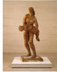
芥川永 《教師と子どもの碑(石膏原型)》 昭和45(1970)年