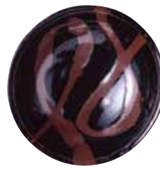
浜田庄司 《黒釉銷流緋大鉢》 昭和30年代後半

原爆の後遺症に苛まれながら、自らの絵の道を模索した広島出身の日本画家・平山郁夫。原爆から生き残った者の責務として描く、信念と祈りが込められた静謐な作品を紹介します。