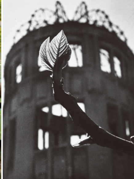
Photographed Hiroshima: Everyday Light Image