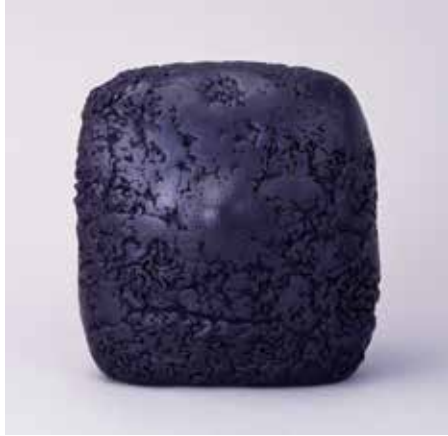
八木一夫 《盲亀》 昭和39(1964)年

1948年に京都の若手陶芸家によって結成された前衛陶芸集団「走泥社」。新時代の陶芸を志向した作家達の作品を紹介します。