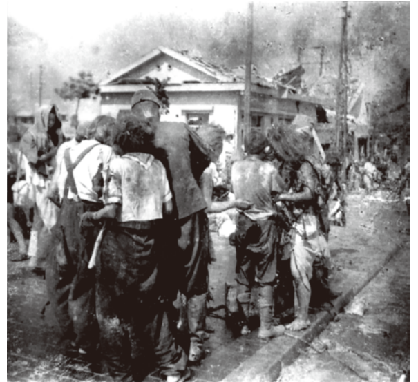
松重 美人 《御幸橋西詰 8月6日午前11時頃(2枚目)》 昭和20(1945)年 中国新聞社所蔵