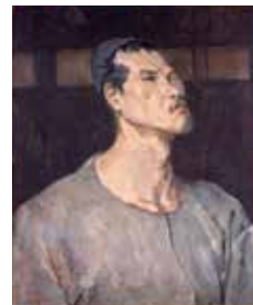
巖光 《帽子をかむる自画像》 昭和18(1943)年

ナチス・ドイツの時代、純血主義の理念にそぐわない作品は「退廃芸術」として貶められました。ナチスによって活動が禁じられた芸術家の作品を、当時の資料を交えてご紹介します。