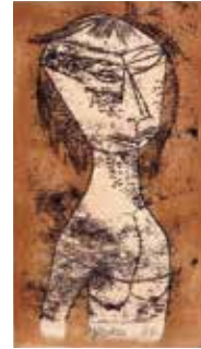
パウル・クレー 《内なる光に照らされた 聖人》1921年