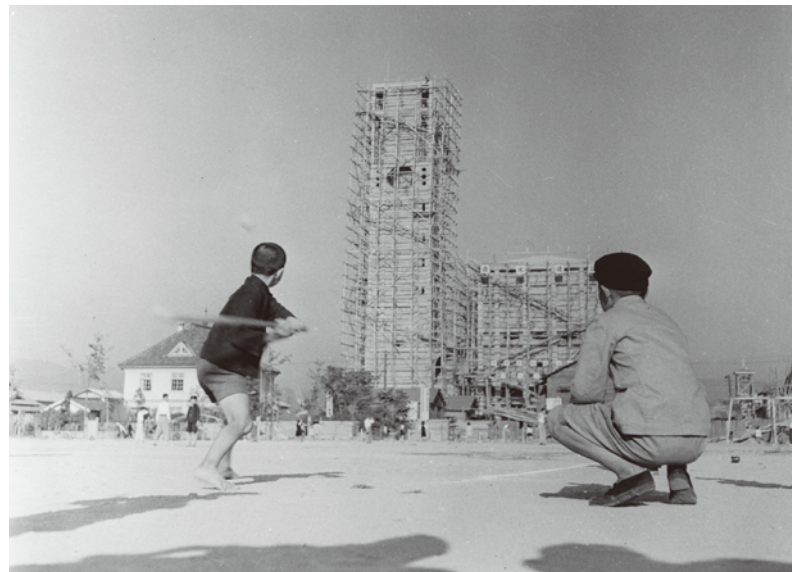
明田 弘司 《轍町小学校で野球する子どもたち 建設中の世界平和記念聖堂》 昭和28(1953)年