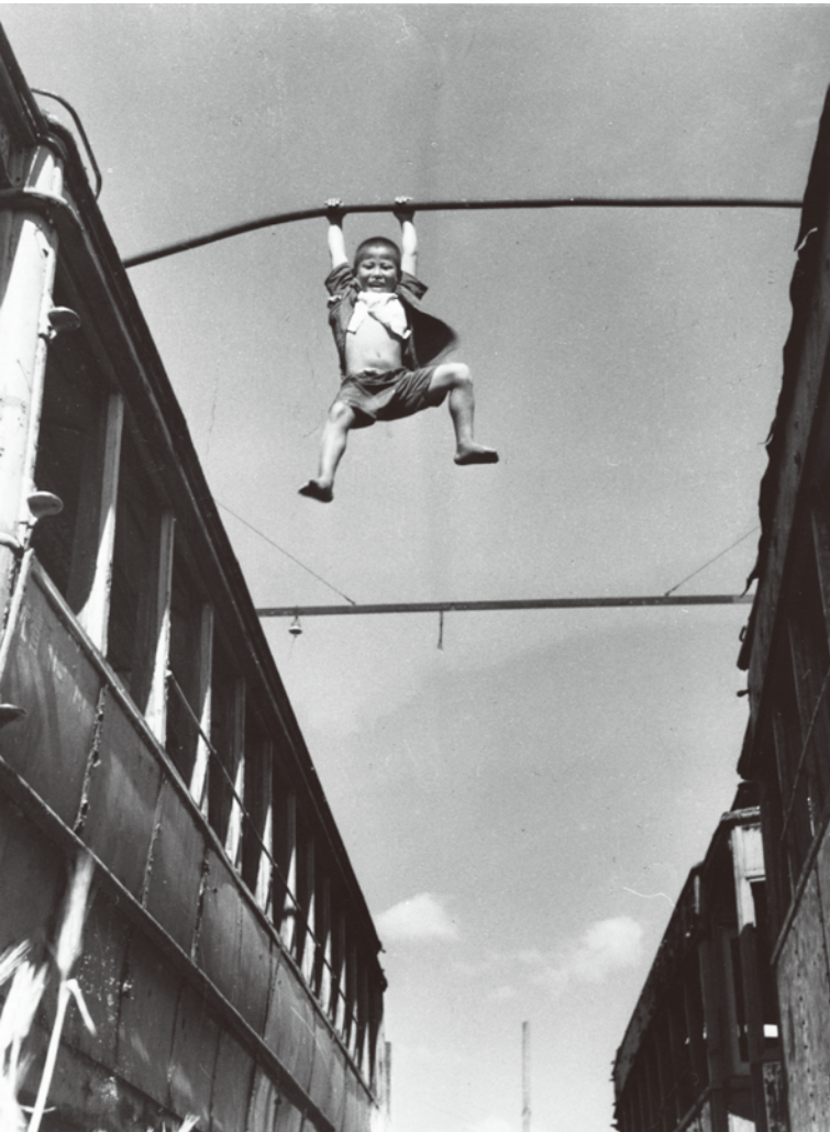
迫 幸一 《子供の世界》 昭和28(1953)年